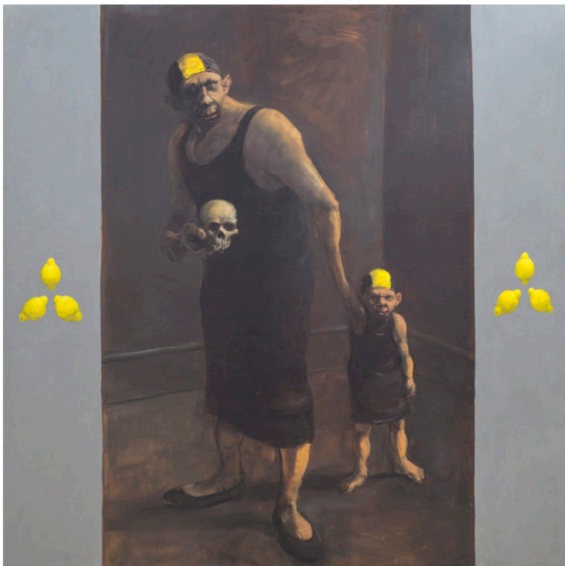
Future Me, 1993-94 Olie på lærred Mål: 230,5 x 230,0 cm Gave den 29. oktober 2009 fra Statens Kunstfond Inventarnummer: 1191

Future Me (Min fremtid) er med den uundgåelige død som ledsager, men med bevidstheden om, at livet fortsætter hos barnet, indtil barnet overtager bevidstheden om, at livet har en ende.