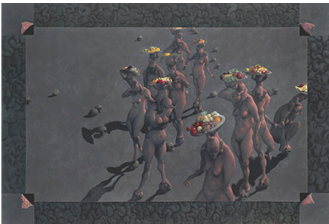
Guds Krigslist, 1991

Rammen er sort, men i billedets fire hjørner vipper noget der ligner hjernemasse frem i rødlige toner, der måske i sammenhæng med de friske frugter, skal ses som udtryk for, at alt håb ikke er ude. Vi er vant til at se os selv stå øverst på "klodens pyramide" som naturens herskere, som en anden guddommelig skabning. I Guds Krigslist har Michael Kvium vendt det hele på hovedet – og følgerne er katastrofale.