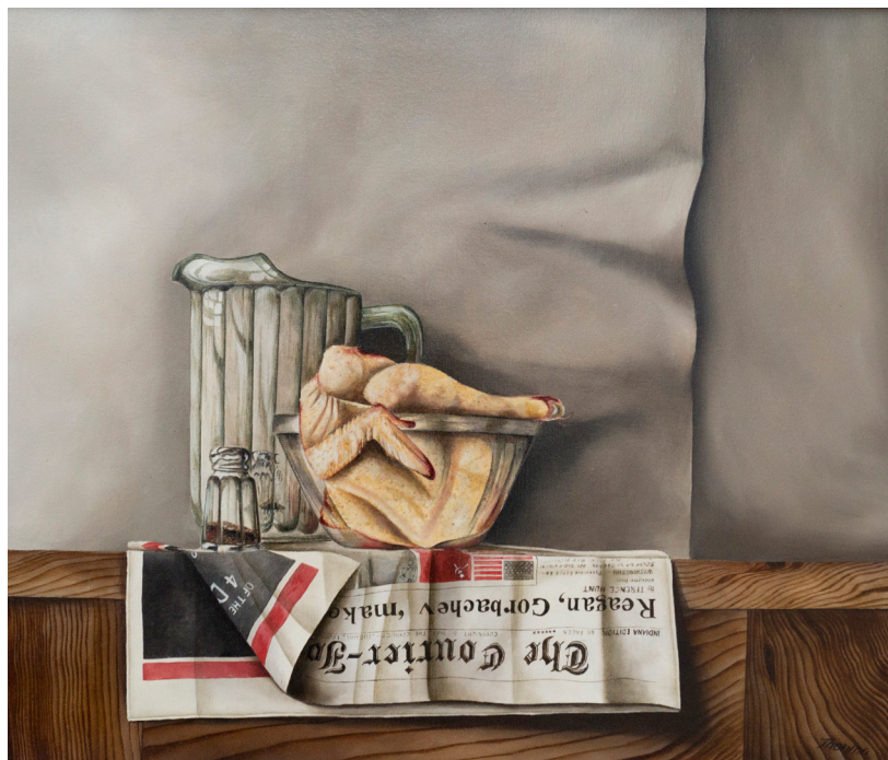
Opstilling med avis og plukket høne. 1987