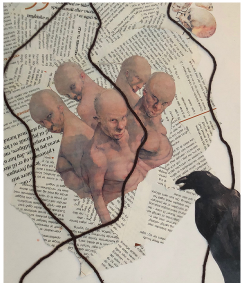
Collager med udgangspunkt i Michael Kviums univers.