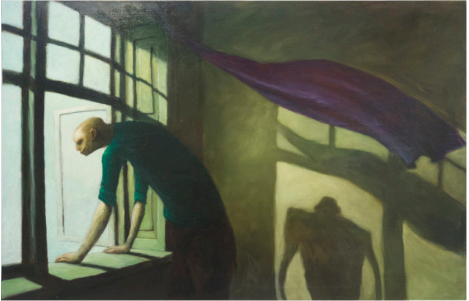
Selvportræt, 1985 Olie på lærred. 130,5 x 200,4 cm Gave 8/8-1985 fra Viggo Nielsen og hustrus legat Inv.nr. 552

I maleriet står en mand – ifølge titlen kunstneren selv – og kigger ud af et åbent vindue. Han har ingen kontakt til beskueren, men betragter derimod en verden udenfor. På væggen i det spartansk indrettede rum ses mandens skygge, der synes at leve sit eget liv uafhængigt af manden. Et gardin blafrer i vinden og skaber dynamik i en ellers statisk skildring. Dette bidrager til en foruroligende stemning af noget surreelt. Det åbne vindue og skyggen betoner begge rent symbolsk en form for psykologisk splittelse. Tematisk kredser værket således om menneskets fortrængte og undertrykte skyggesider. Dette er karakteristisk for Kviem, hvis værker ofte udforsker de fortrængte og uønskede sider af tilværelsen.