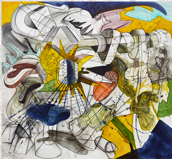
LARS NØRGÅRD BLACK BIRDS 2015

Turen bragte os også ind i kunstmuseets bugnende -meget bugnende magasiner.