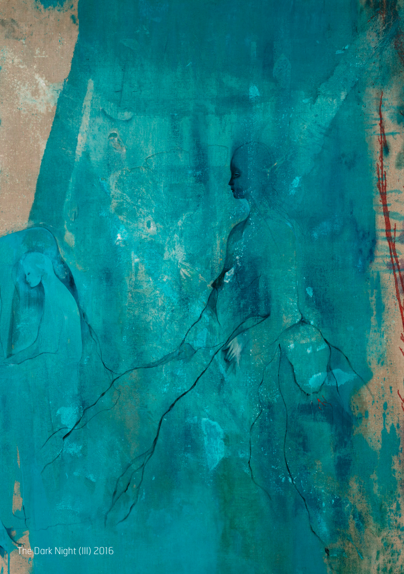
The Dark Night (III) 2016