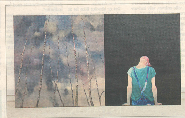
Kunstmuseets nyeste Kvium-erhvervelse, maleriet "One of Those Days", et vigtigt element mangler: et lille lærred med en godt plettet malerkud, der skal hænge ud af lofommen i de blå buker.