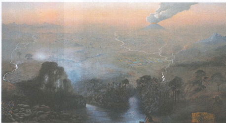
Maleriet "Epilog". Foto: Erik Meistrup.

En installation af forstælle Udstillingen "Kærlighed, Frygt og Ondskab" er et ambitiøst projekt, der i sin færdige form også er en installation, fordi alle værkerne udgør en samlet fortælling og præsenteres som en forsat udviklende historie om netop de tre følelser og dermed forskellige psykiske tilstande. Fortællingen starter i det personlige og udvikler sig så på en nærmest absurd måde gennem spring i tid og sted, og alligevel kan man godt følge den underliggende fortælling. Noget af det første, man aner er, at første trin "Kærligheden" er en skrøbelig og sjældn følelse, der ikke er