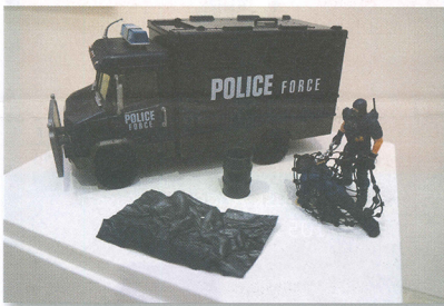
Politi tog og bogge med.

selv en anden kunstform, idet de er litterære udsagn og læst i løb af oplæg til en slags novelle, der blander forstælleselementer fra den rå realisme over mere fabulerende udsagn, hvor fortid og nutid blandes.