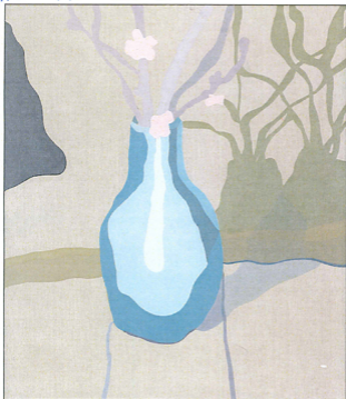
Et af Morten Buchs hverdagsmotiver: en vase.