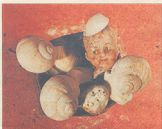
▲ Fra starten af 2000'erne.