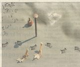
▲ Fra 1990'erne.

fotografen, der fandt de skæve detaljer: det smadrede lokum, mikrokontakter osv.