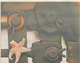
▲ Fra 1990'erne.