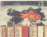
▲ Fra starten af 2000'erne.