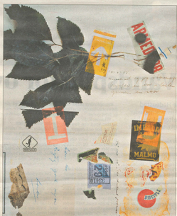
▲ Fra „Folkelige spor“ - 2000-2011.