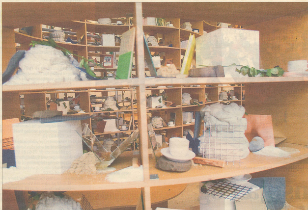
▲ Bjørn Nørgaards fantastiske reel-skulptur har endnu ikke fået en officiel titel. For sig selv har han kaldt den „Fra min fars bogsamling“, fordi alle bøgerne er hentet på hans afdøde fars boghylder.