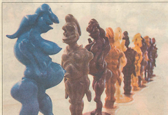
▲ Bjørn Nørgaard-figurer på stribe - fascinerende med deres blanding af grimt og smukt.

vej. Nogle værker fra museets samling kigger tilbage på hans karriere, men ellers dominerer nye værker -