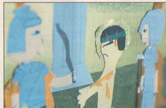
Stensballe skolen - påskeevangeliet i papirklip.