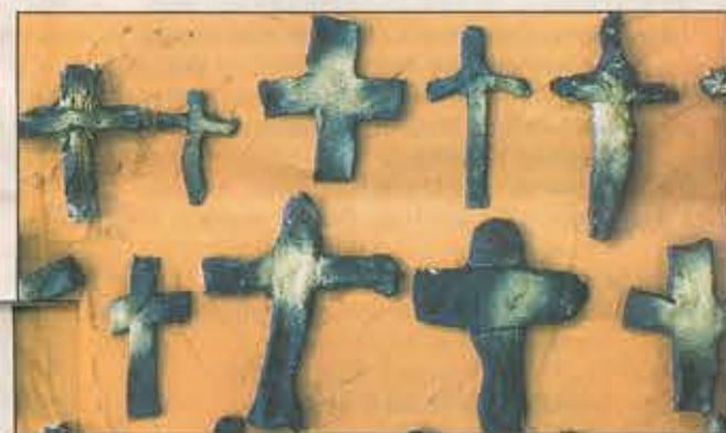
Kors på rød baggrund. Bankagerskolen.