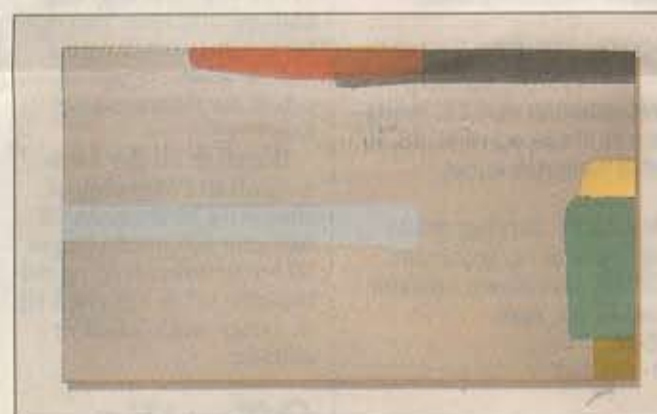
„Matskive [28]“. 70 x 120 cm.