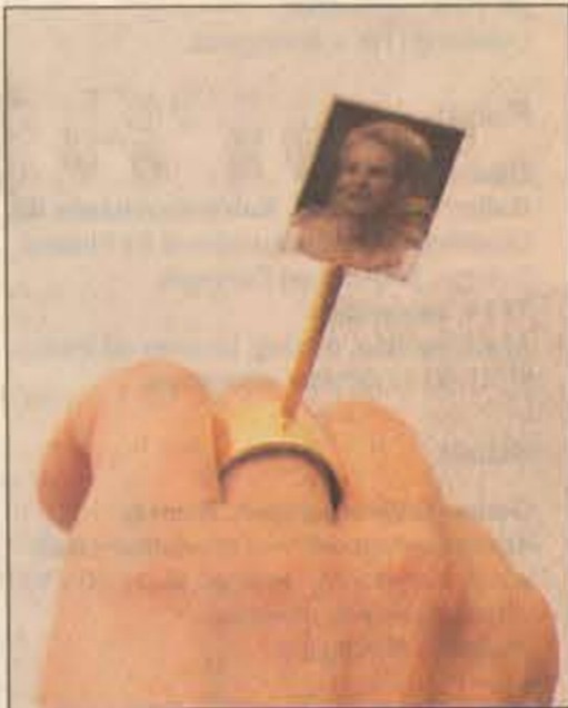
Vielsesring med foto af den elskede, og fotoet er nemt at skifte ud.