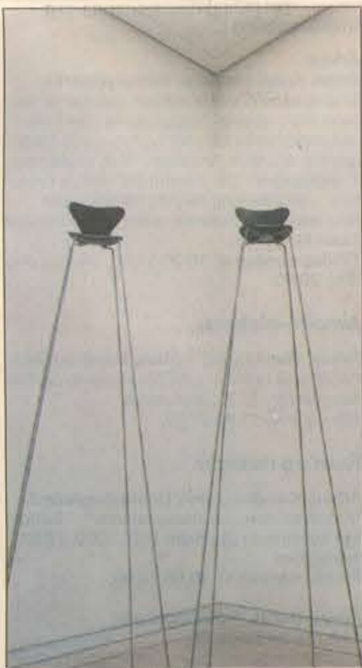
Ideen til de langbenede stole udsprang fra min oplevelse af kunst og design i dag som noget, der har mistet jordforbindelsen, skriver Ask Emil Forlev Skovgaard i kataloget.