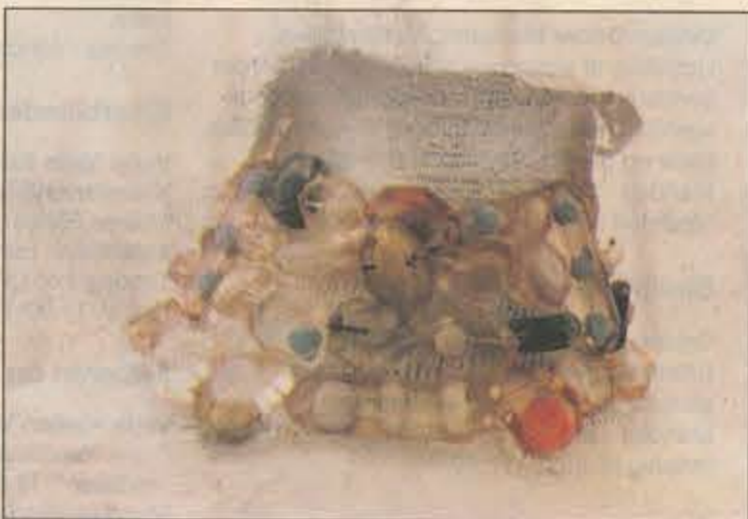
Halskæden, en såkaldt choker, er designet af Carolina Vallejo.