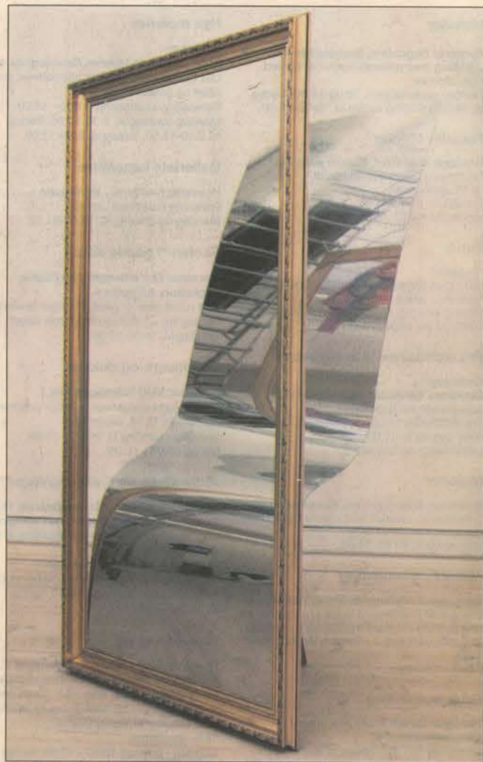
En ny tronstol til dronning Margrethe. En spejlblank stålplade i gulddramme.