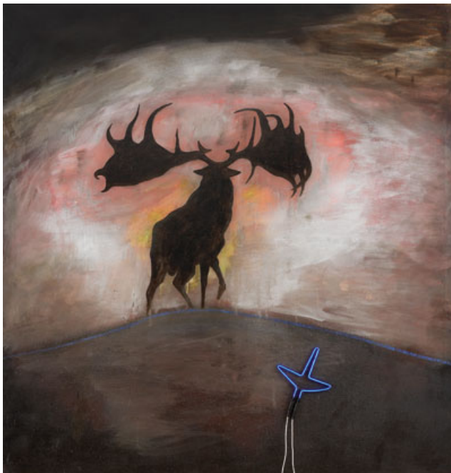
En god dag at dø II, 1984 og I am a stag of seven tines, 1985