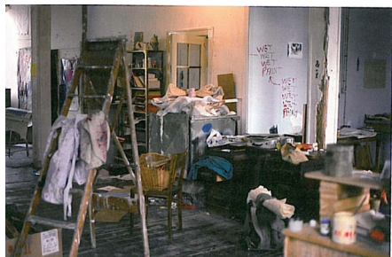
Interiør fra Værkstedet Værst