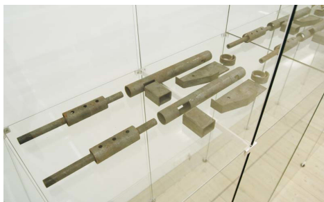
Partisansøm, økser og maskinpistoler fra retrospektiv udstilling på Horsens Kunstmuseum, 2005