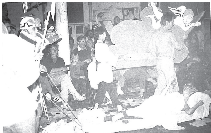
Kunstnere og publikum under opførelsen af Nibelungens Ring

stigste gæster på Rosenørns Allé. Først efter afviklingen af Værkstedet Værst begyndte han at samarbejde med Christian Lemmerz, og de to videreførte værkstedets navn i Performancegruppen Værst.