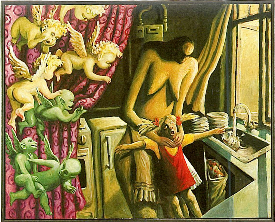
En køkkenscene, 1986 (Kilde til inspiration, storyboard til "Grød")