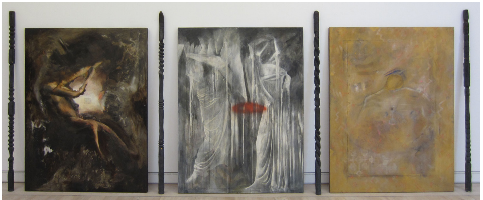
The Birth of Athena, 1987, The Death of the King, 1987, The Art of the Alphabet, 1987 og Objekt, 1987