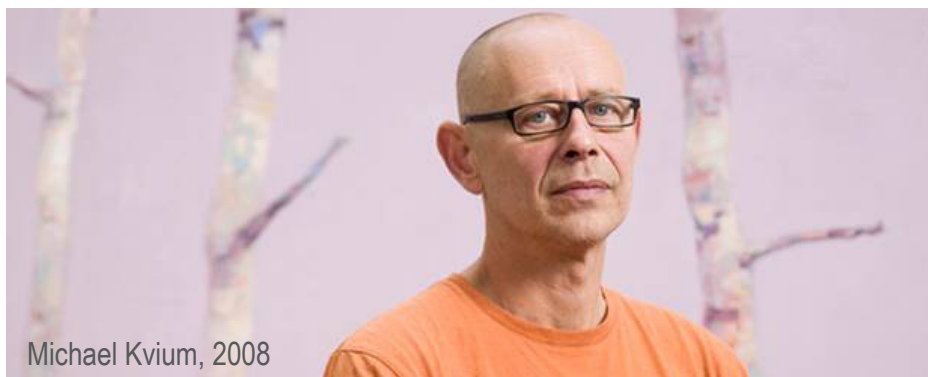
Michael Kvium, 2008

Er født i 1955 og havde sin barndom i Horsens. Han kommer ud af en børneflokk på 8 børn. Han familie var katolsk, og har selv beskrevet sine forældre som fanatisk religiøse. Kvium gik på den katolske Sankt Ibs skole, og hele familien gik sammen til latinsk højmesse hver søndag.