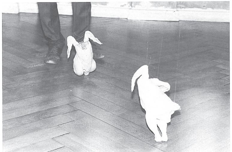
2) kom og knep mig . . .