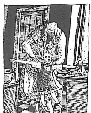
Udsnit af storyboardet til performanceen "Grød", 1986-88