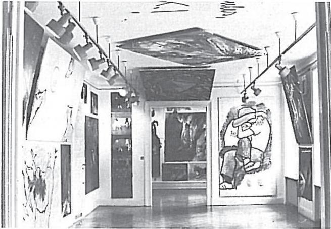
Interiør fra Kniven på hovedet-udstillingen