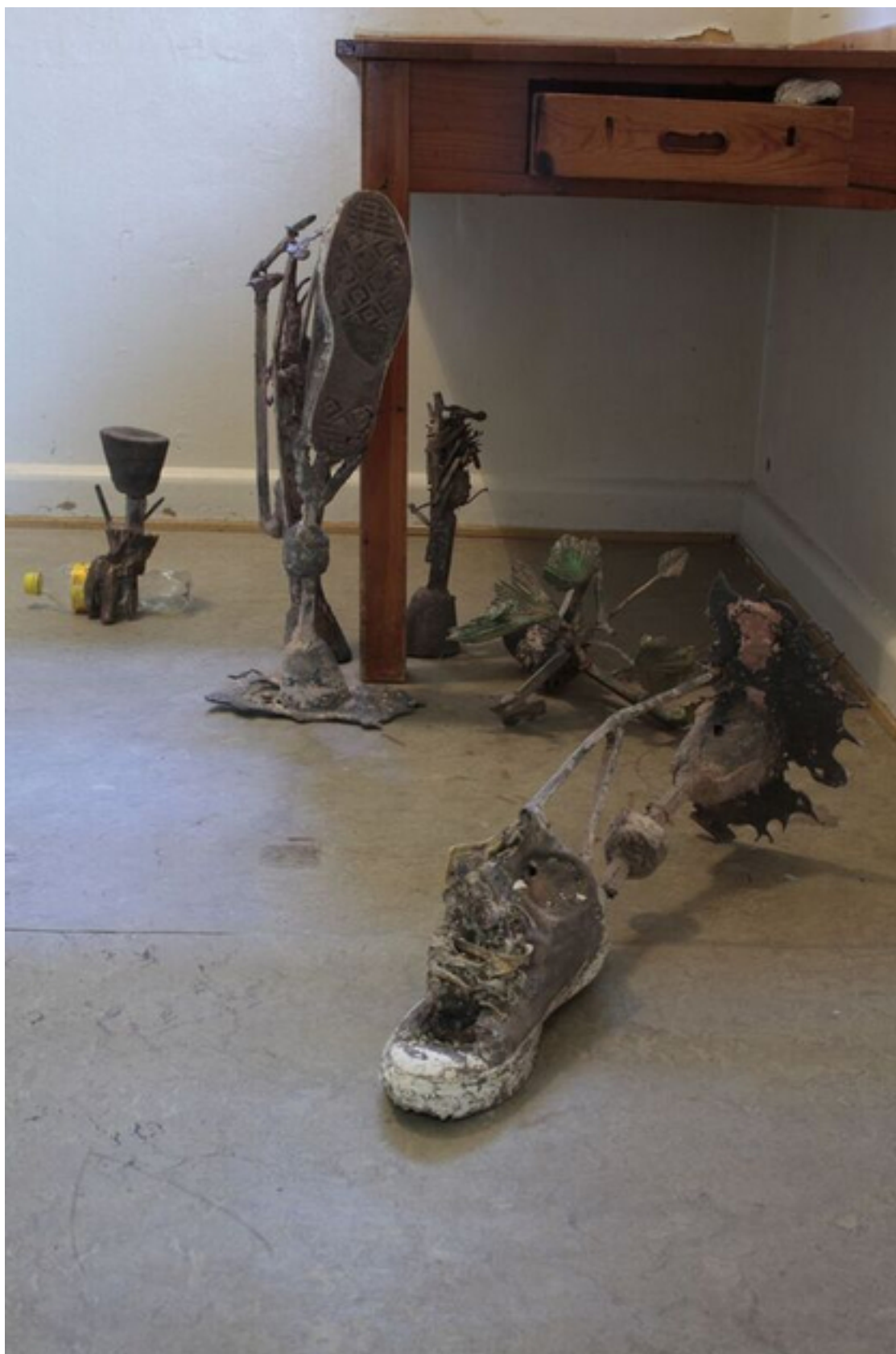
Biba Fibiger: Nature knows better than human, how to die. Settling down elsewhere , 2016, Bronze, squash sodavandsflakse, collage.