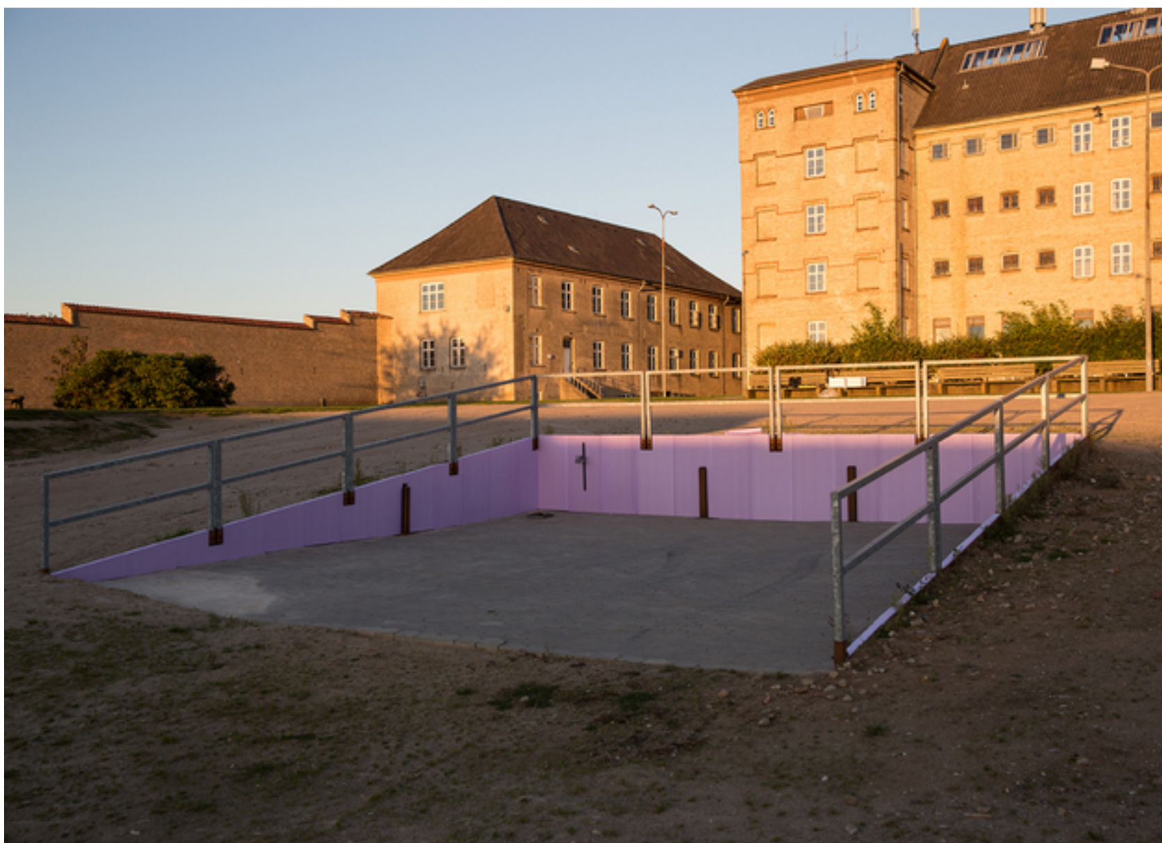
Marco Spörle: Natural Selection og Membran , 2016, Aluminum, voks, stål, avispapir og silke.