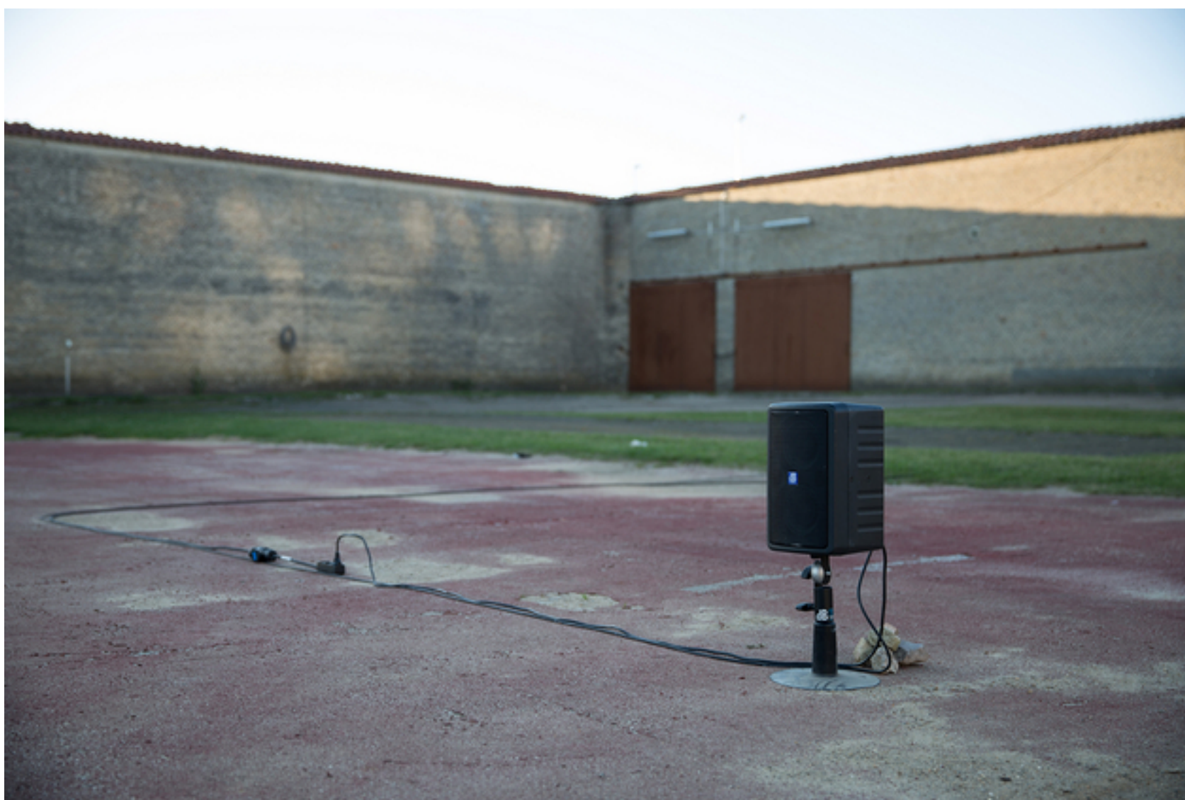
Emil Alenius Boserup: Passage (En fri skulptur - ved åbningen lørdag den 10. september kl. 13-14) , 2016, Stål, sten, gummi, lyd og streger.