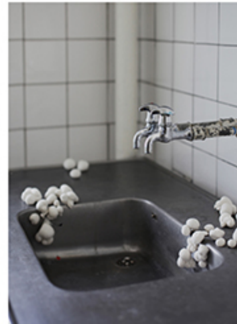
Veronica Rigét: Mycelium , 2016, Værket består af 450 rå porcelænsafstøbninger af svampe af typen lycoperdon perlatum (støvbold).