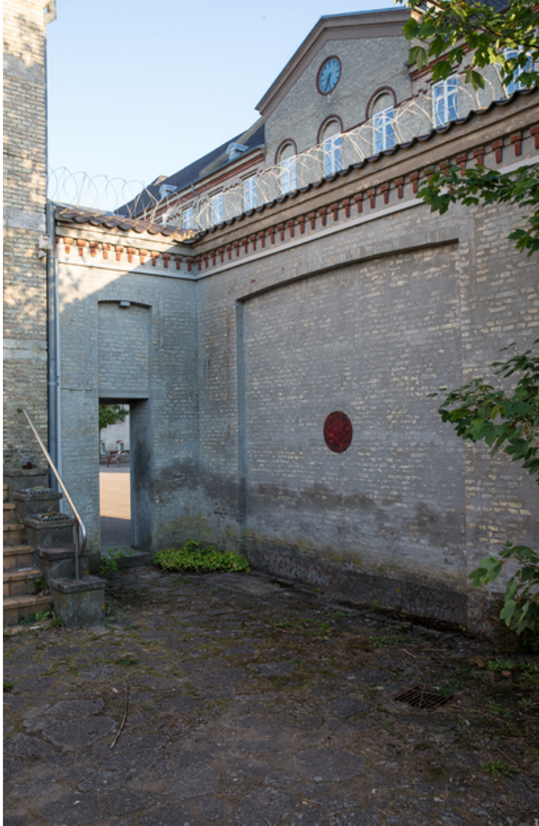
Esben Gyldenløve: Eagle vs. Snake , 2016, Relief.